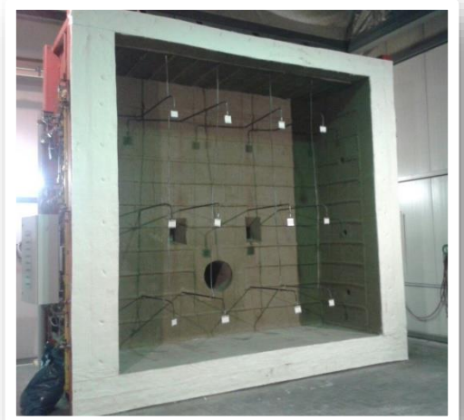
Brandofen 4 x 4 m – Innenansicht