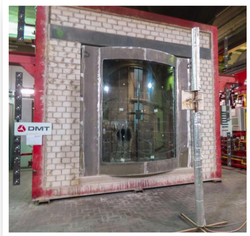
Brandofen 4 x 4 m – Außenansicht

Bahnanwendungen - Brandschutz in Schienenfahrzeugen - Teil 3: Feuerwiderstand von Feuerschutzabschlüssen