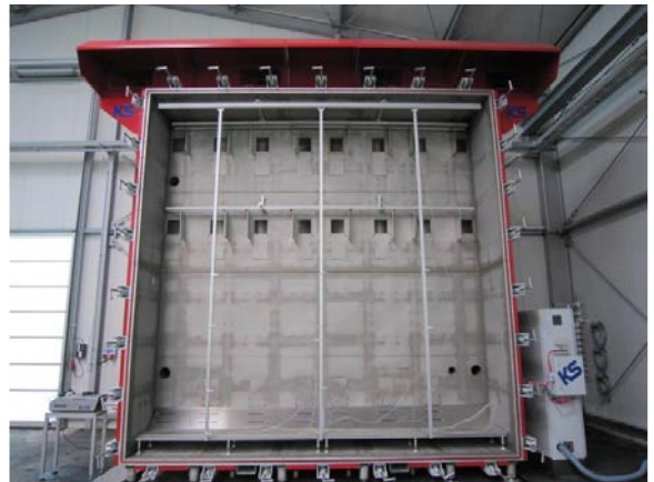
Rauchprüfkammer 5 x 5 m – Innenansicht

Prüfungen zur Rauchdichte für Rauchschutzabschlüsse (Türen, Tore, Klappen, Fenster) zur Bestimmung der Leckrate