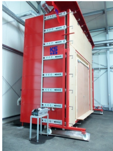
Rauchprüfkammer 5 x 5 m – Seitenansicht