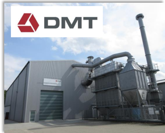
DMT Prüfzentrum in Lathen (Emsland)