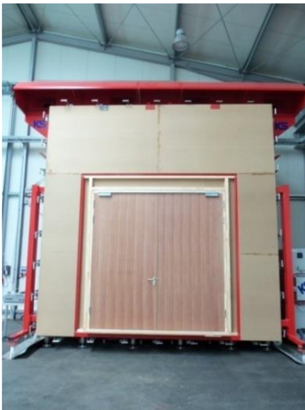
Rauchprüfkammer 5 x 5 m – Frontansicht Beispiel Verkleinerung auf 3,4 x 3,4 m