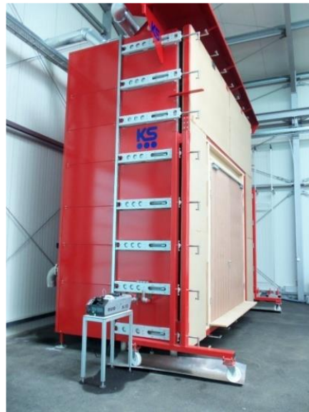
Rauchprüfkammer 5 x 5 m – Seitenansicht