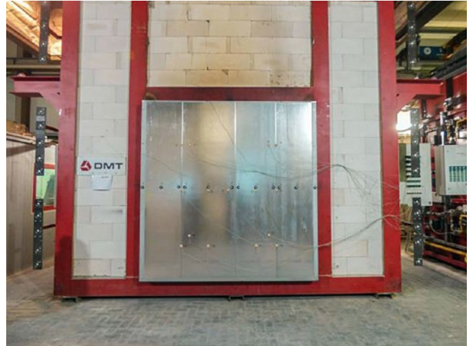
Brandofen 4 x 4 m – Verkleinerung auf 2,42 x 2,48 m (Prüfung von Trennflächen des Typs A, B und F)

Das Bild rechts zeigt eine Variante der Verkleinerung der Kammerabmessungen. Auf Wunsch sind andere Varianten der Verkleinerung möglich.