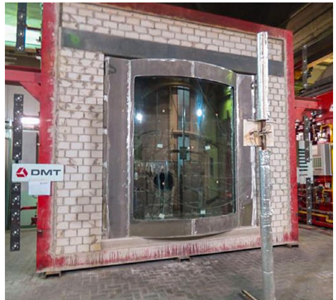
Brandofen 4 x 4 m - Außenansicht

Bahnanwendungen - Brandschutz in Schienenfahrzeugen - Teil 3: Feuerwiderstand von Feuerschutzabschlüssen