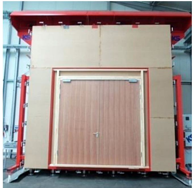
Rauchprüfkammer 5 x 5 m – Frontansicht Beispiel Verkleinerung auf 3,4 x 3,4 m

Prüfungen zur Rauchdichte für Rauchschutzabschlüsse (Türen, Tore, Klappen, Fenster) zur Bestimmung der Leckrate