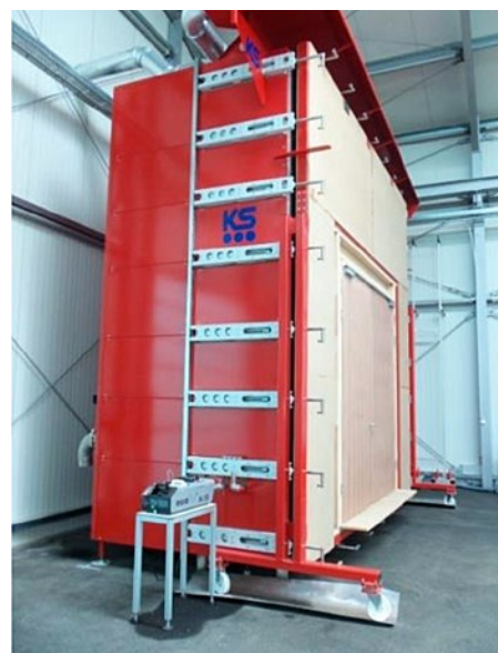
Rauchprüfkammer 5 x 5 m – Seitenansicht