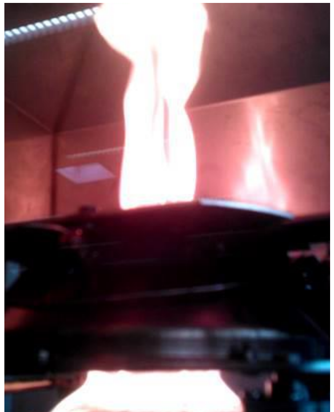
Durchführung einer Brandprüfung