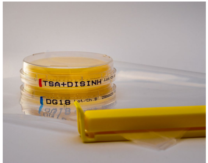
Abklatsch-Set zur Beprobung von Oberflächen